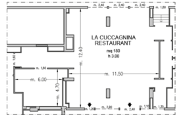
Piano Terra / Ground Floor